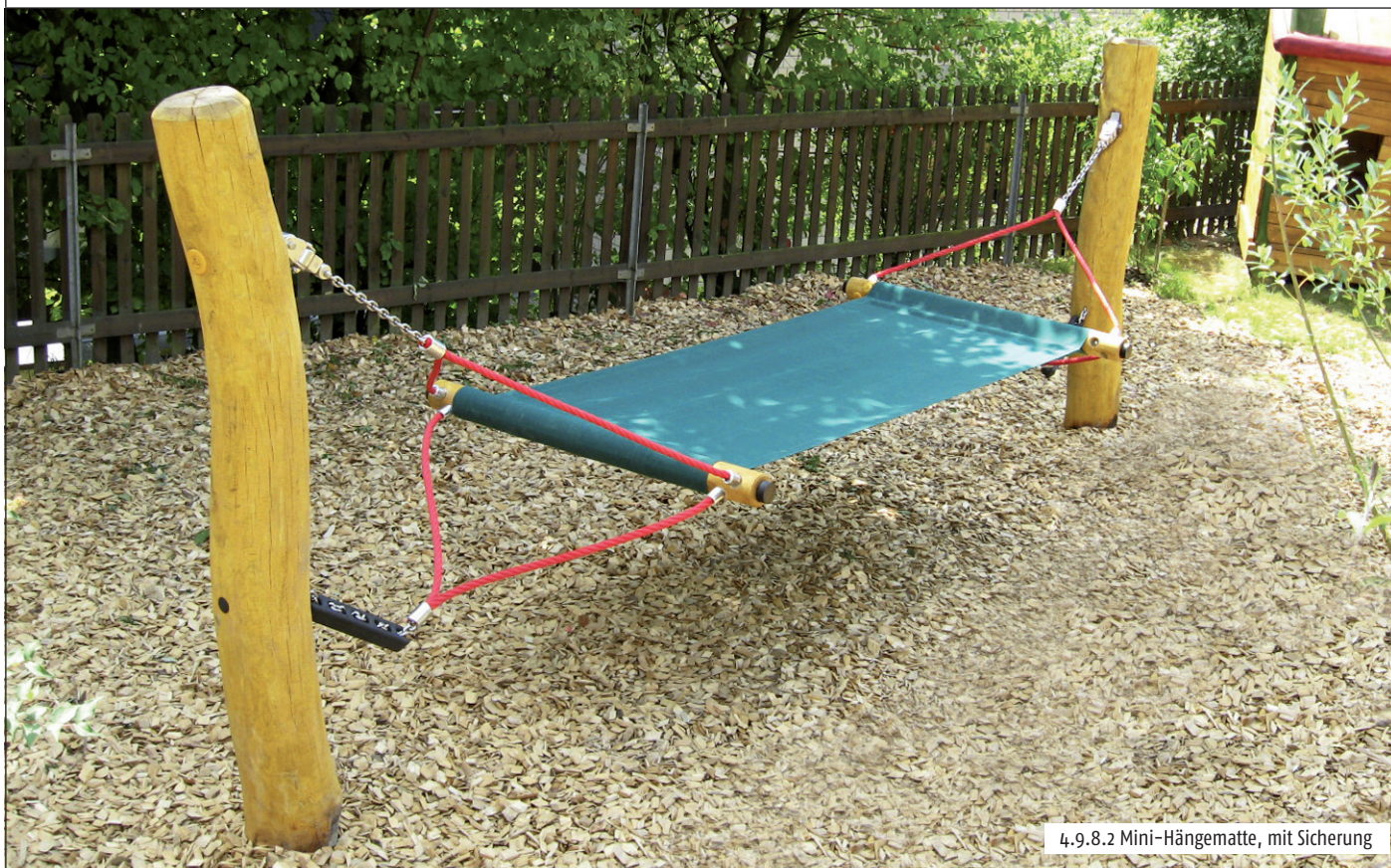
4.9.8.2 Mini-Hängematte, mit Sicherung